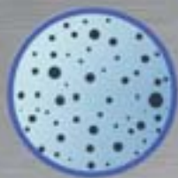
Voda filtrovaná pískovou filtrací