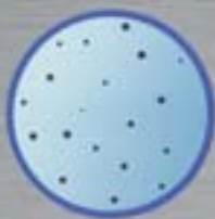
Voda filtrovaná ClearPro® technologií